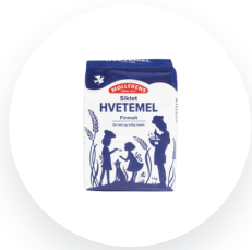
Møllerens Hvetemel siktet