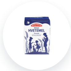
Møllerens Hvetemel siktet