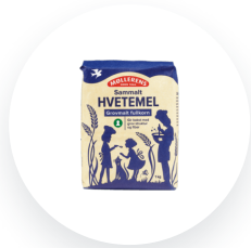
Møllerens Hvetemel sammalt grovmalt