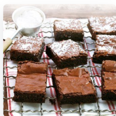
Brownies med appelsin