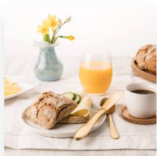
Eltefrie rundstykk er