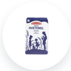
Møllerens Hvetemel siktet