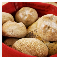
Grove rundstykk er med rug