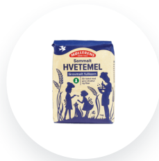
Møllerens Hvetemel sammalt grovmalt