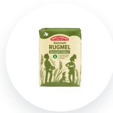
Møllerens Rugmel sammalt grovmalt