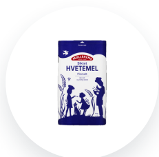
Møllerens Hvetemel siktet